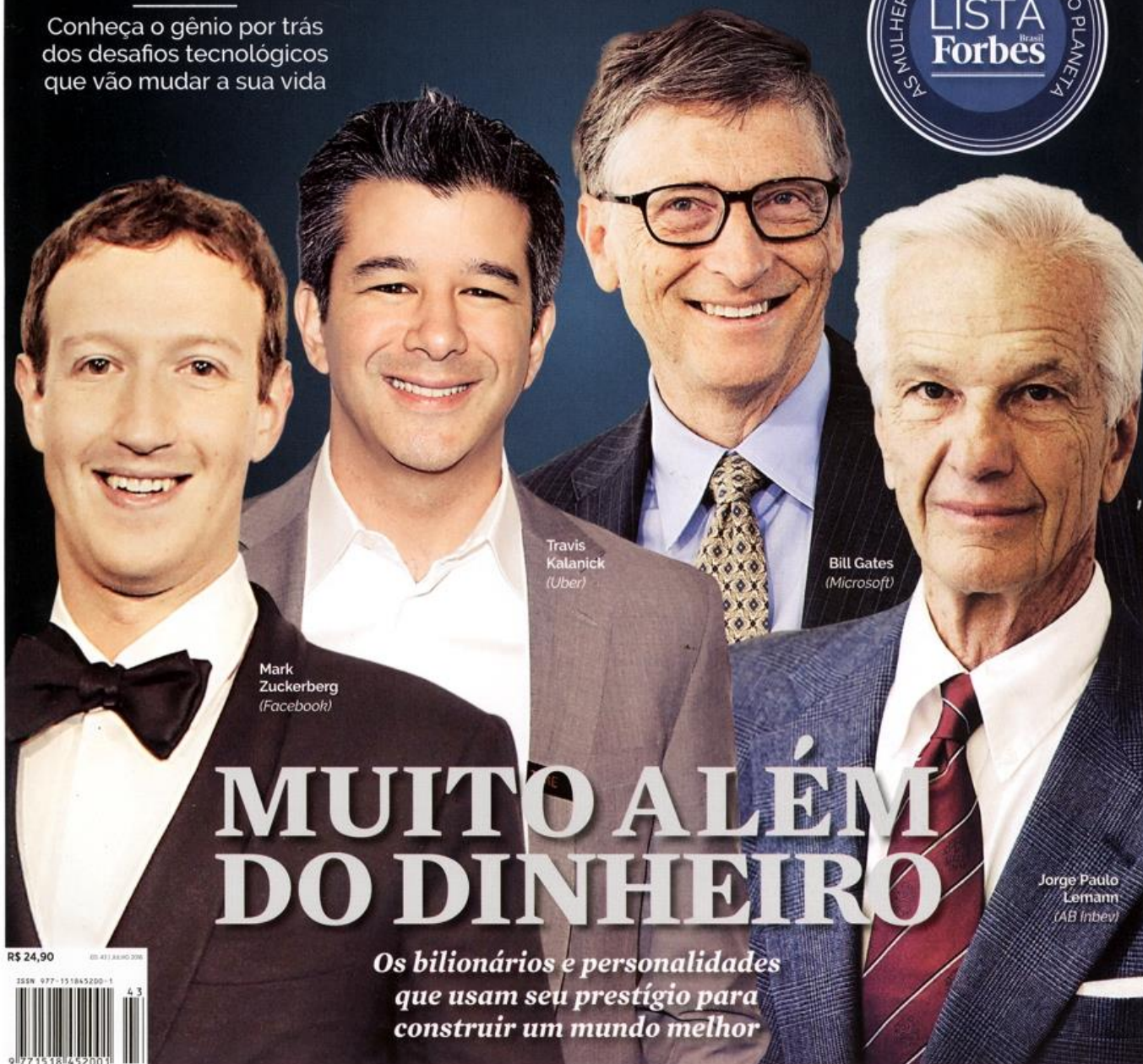
Mark Zuckerberg (Facebook)